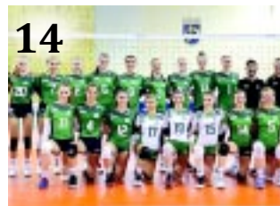
14 RÖPLABDA EB