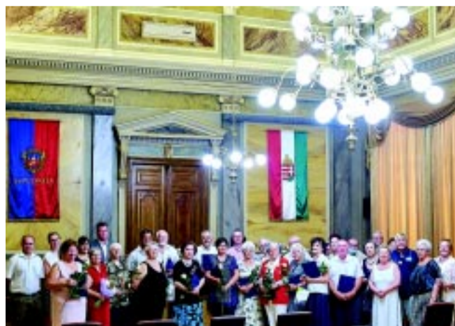
A díjazottak és pályázók csoportképe az ünnepség után. Az Idősügyi Tanács azóta az alkotó idősek számára is ír ki pályázatot. (Részletek a 15. oldalon.)