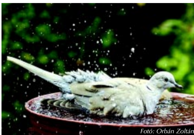
Balkáni gerle itató

A városi, települési fák, fasoroknak egyre nagyobb szerepük van az éghajlatváltozáshoz való alkalmazkodásban is, nem mindegy hát, hogy a hőszegélyek, kánikulák alkalmával (is) elegendő vízhez jutnak-e. A már elültetett fiatal csemeték pedig nagyobb eséllyel maradnak életben, ha legalább az első években rendszeresen locsoljuk őket. Ha megteheted, reggel vagy este te is vigyél néhány vödör vizet az utcán álló fákhoz! Ez különösen fontos a belvárosi, körbebetonozott növények esetében. Társasházak-