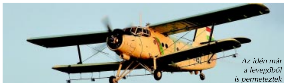
Az idén már a levegőből is permeteztek

A szabadban, fedetlenül tárolt vízgyűjtő edényekben, a különböző tárgyakban megülő esővízben akár egy hét alatt is kifejlődhetnek a szúnyoglárva. A szúnyogirtó kezelés kiegészítéseként ajánlott, hogy az ingatlan tulajdonosok szüntessék meg, rendszeresen ürítsék vagy takarják le az épületek körüli kisebb, pangó vízgyülemeket.