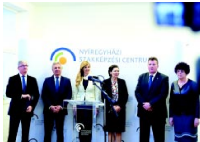
Az államtitkárok és képviselők, az alpolgármester, valamint az NYSZC vezetése társaságában

Ha csak a szakképzési centrum intézményeit tekintjük, az önkormányzat az elmúlt években energetikailag felújította a Sipkayt, az ÉVISZ-t, a Széchenyit, az Inczédyt, s 2021 végére befejeződött a Wesselényi energetikai felújítása is – tette hozzá az alpolgármester. Az összefogást hangsúlyozta az Innovációs és Technológiai Minisztérium helyettes államtitkára is. Azt az erőt, mely